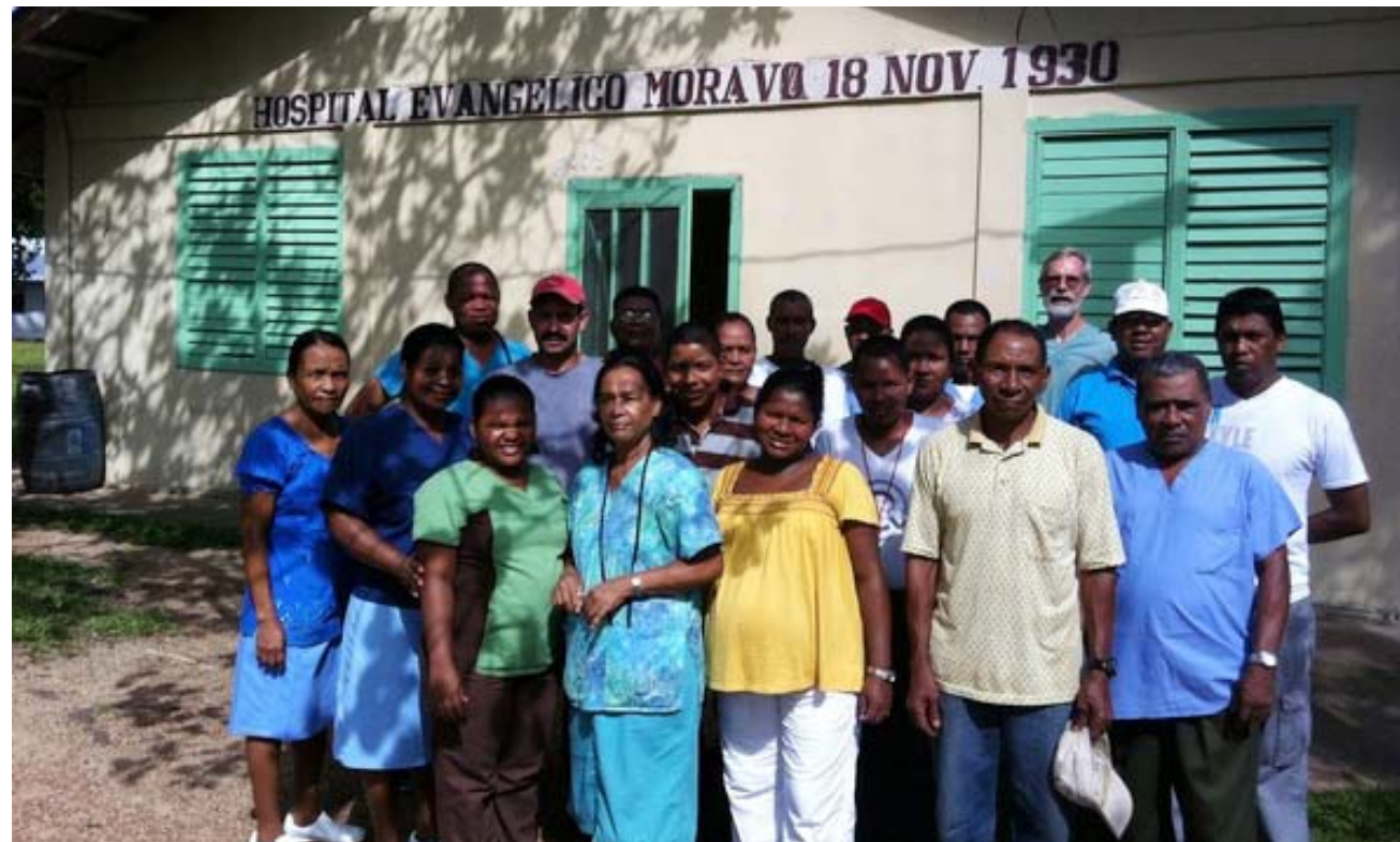
Clinica evangelica morava v Hondurasu.

Celková situace v Hondurasu potřebuje naše modlitby. Honduraská církev se musí potýkat s násilím ve své zemi pramenícím z obchodu s drogami. Místní Jednota bratrská má okolo sebe mnoho výzev, včetně svých vlastních vnitřních