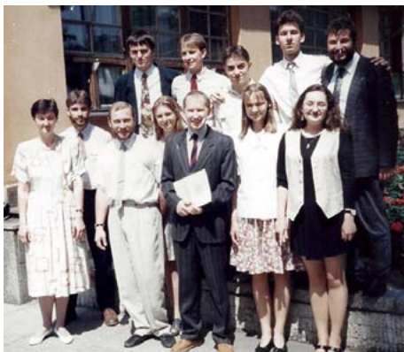
Absolventi denního studia MŠMLZ, 90. léta.

o úplné počátky denního studia v roce 1994, bylo tehdy studium studiem pomaturitním, zařazeným do sítě škol a končilo se maturitou. Takto školu úspěšně ukončilo v prvním roce osm studentů a ve druhém devatenáct. Pak se školský systém musel přetransformovat – pomaturitní studia na vyšší odborné školy – a náš projekt nebyl přijat. Následovala roční pauza a nová koncepce víceletého denního studia. S novým začátkem začalo studovat