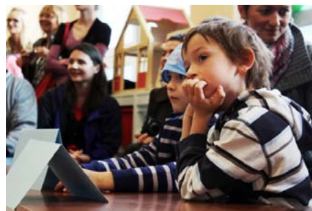
Zápis do ZŠ Sion.

Vlastně v nejrůznějších volnočasových aktivitách, na kterých jsme pracovali