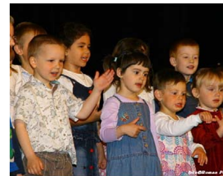
ZŠ Brána – školáčky při vystoupení.

Novopacká Brána je školou s estetickým zaměřením. Upřednostňuje třídy do 15 žáků, podle učitelů jsou totiž v menším kolektivu pevnější vztahy, lepší kontakt učitele a žáka i spolupráce s rodiči. Škola umožňuje nadaným dětem vzdělávat se do větších hloubky. Hodnotí se převážně to, co dětem jde, jsou podporovány jejich silné stránky, respektovány odlišnosti. Součástí výuky jsou také vycházky do přírody.