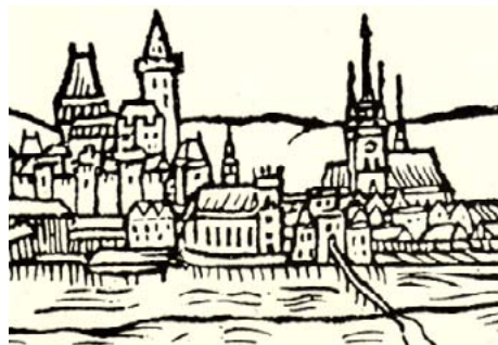
Bratrská škola a sousedící sbor na vyobrazení Přerova z roku 1593. Škola je budova se třemi štíty.

lpěním na memorování a přehnaným respektem k autoritám, pěstoval se zde tradiční český reformační důraz na zdokonalování jedince prostřednictvím vzdělání. Bratrské školství také dalo přirozeně vzniknout množství spisů i učebnic kupříkladu z oblasti českého jazyka, dějepisu, zdravotnictví (zajímavostí je například první porodnická kniha Zprávy a naučení ženám těhotným a bábám pupkořezným z roku 1519), přírodovědy, teologie, filosofie, psychologie či výchovy.