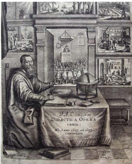
Jan Amos Komenský

smlouvě, jsou témata napomáhající každému jednotlivci k motivaci v jeho osobním, duchovním i duševním růstu. Objevili, že texty jsou plné důrazů na kvalitu nového života plně integrovaného do Ježíše Krista. Právě Ježíš byl pro ně vzorem nade všemi vzory, jehož vliv měnil životy lidí okolo. V důsledku toho přijali za klíčovou