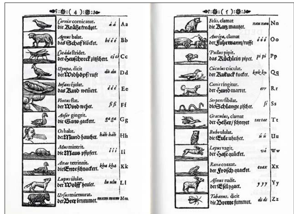
Vyobrazení zvířat v Komenského učebnici Orbis sensualis.