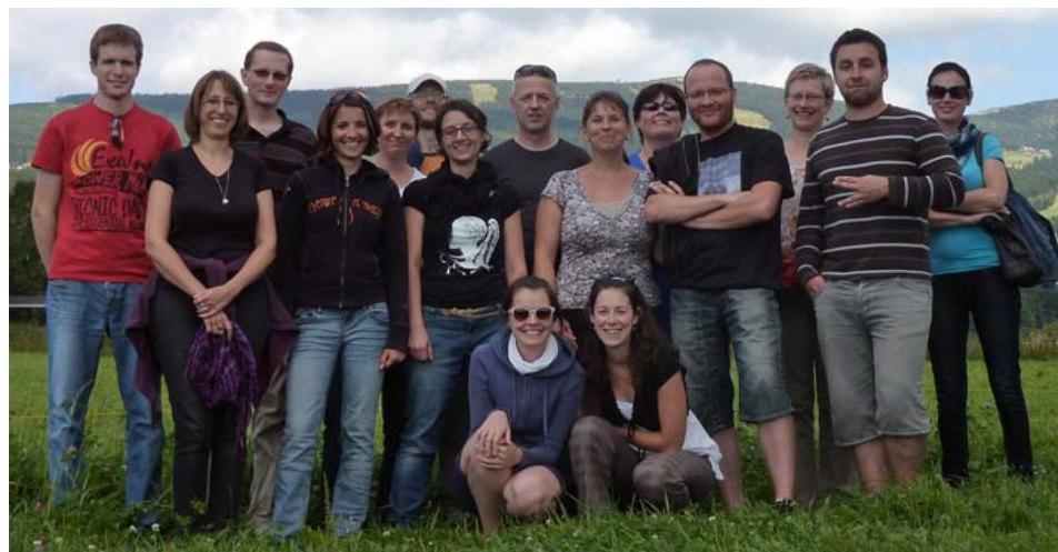
Učitelský sbor ZŠ J. A. Komenského v Liberci.

otevřeny i pro děti postižené, naše škola se navíc stala průkopníkem v programu domácího vzdělávání, které je dnes již uznávanou a funkční alternativou ke klasické školní docházce. Plná čtvrtina učitelského sboru jsou muži. Pořádáme mnoho akcí pro rodiny žáků a také provozujeme Středisko volného času Narnie, které zastřešuje přes dvacet zájmových kroužků a volnočasových aktivit.