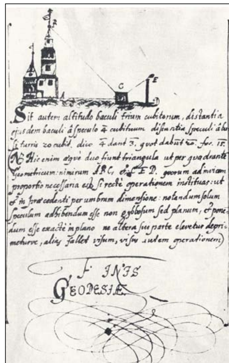
Komenského pojednání o geodézii.

z většinové evangelické církve, tedy mladí novoutrakvisté. Pro bratrské školy bylo typické, že členové Jednoty z řad šlechty, jakými byli například moravští Žerotínové, nezištně