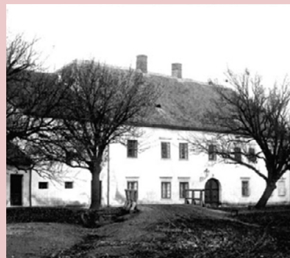
Bratrská škola v Ivančicích.

velmi sečtělých. Byli v té čeládce 4 kazatelé, kolik bylo jáhnů a pomocníků, ani jsem si nepovšiml. Všichni vynikali tak velikou skromností v řeči, v jednání, zbožností, uhlazeností mravů, vroucností náboženskou, a v bohoslužbě i vážným chováním, svatostí života, ryzností a upřímností, vzděláním vloh a učeností, znalostí svatých Písem, pravou lidskostí, pohostinností, mírností, cudností, střídmostí, a vů-