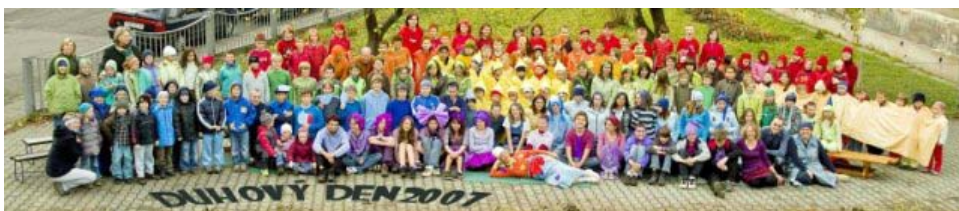
“Duhový den” na ZŠ J. A. Komenského v Liberci.

dnes, jak víme, zvýšená poptávka. V původním plánu byla školka určená pro dvacet osm dětí, pro niž by se přebudovala současná farní budova. Sbor dostal registraci a rozeběhly se přípravné práce v domě. Zásadní komplikace však přišla s vyjádřením hygieny, která projekt ve stávající podobě nepovolila, a navíc snížila kapacitu na osmnáct dětí. Což by se projevilo i v plánovaném rozpočtu. Vzhledem k tomu, že není možné dát budovu do požadovaného stavu do počátku nového roku, aktuální registrace propadne a bude nutné ji vyřizovat znovu. Turnovský sbor tedy hledá, jak dál, s přáním, aby školka mohla být otevřena v září 2014.