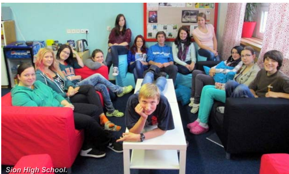
Sion High School.

Lékařská prognóza nebyla moc povzbudivá, lékaři dokonce rodinu připravovali i na nejhorší možnost. Ten den jsme se na prvním i druhém stupni společně modlili a čekali na zprávy. Za tři hodiny bylo po všem, doktor nemohl uvěřit, jak skvěle vše proběhlo. I když předpokládal měsíční rekonvalescenci, holčičku propustili za týden. I když si myslel, že příjem potravy přijde v horizontu měsíců, hned druhý den zkusila colu, další den zkusila jíst, a tak to pokračovalo den ze dne a naše hrdinka si užívala něco, co za celý svůj život nemohla – jak chutná jídlo a pití. Dnes je v páté třídě a jako malá slečna je šťastná, že žádnou hadičku ani žádnou díрку do krku mít nemusí.