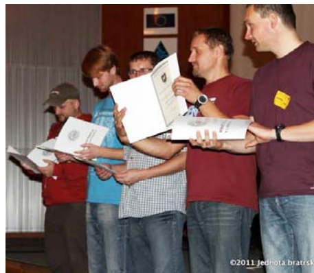
Absolventi MŠMLZ v roce 2011.

čtrnáct studentů, dále jsme přijali několik studentů z končící Harvest International Bible University a další. Později jsme přešli na dálkovou formu. Začali mnozí, ale poměrně dost posluchačů celé studium sice absolvovalo, ale nedotáhlo do konce. V roce 2008 přišel další nový začátek, prvních absolventů bylo čtrnáct a na další teprve čekáme. Dalo by se tedy říci, že od začátku denního studia jej úspěšně ukončilo minimálně 53 lidí. Studovalo ovšem dvakrát