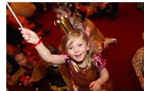
Mateřská škola Sion