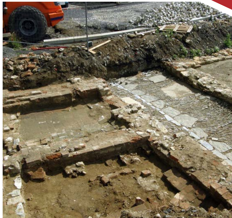
Základy bratrské školy v Přerově, sousedícího bratrského kostela a dlážděná cesta mezi nimi. Objev byl učiněn v roce 2012 (viz článek v Jbulletinu č. 1/13).

prodlení svedl a zastavil a dotčené mistry školní bludného učení odtud vybyl a dále žádných takových škol na gruntech svých zarážeti nedopouštěl ani takových bludných učitelů netrpěl. (...) Jest mi to jistě s nemalým podivením, kdo jest směl V. C. Mti takovými věcmi zpravit, ježto všechněm v tomto markrabství jest vědomé, že nic nového a prvý nebývalého na gruntech mých není začalo. Ale (...) v pravdě o tom oznámiti poníženě mohu, že ta škola ještě za pana děda mého jest byla, načež i nadání jeho, potom potvrzení pana otce mého i mé pod pečeti jejich a mou i jiných dobrých lidí pečeti, kteréž na tu školu se vztahující jest, mají. Taky, aby jací bludní učitelé a školní mistři tu býti měli, žádné o tom vědomosti nemám. (...) Protož V. C. Mti se vši poddaností poníženě prosím, že takovým zprávám o mně dodaným milostivě věřiti a místa u sebe dávati neráčíte.“