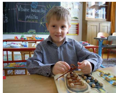
ZŠ Brána – novopacký prvňáček.

Dnes má základní škola 36 žáků, mateřská 29 dětí a zaměstnanců je 14, včetně 3 provozních. Máme také školní družinu i jídelnu (výdejnu jídla).