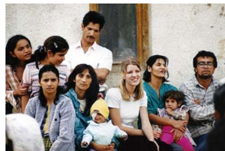
Misijní výjezd školy na Ukrajinu.

Škola začala svou činnost v roce 1991, kdy ve spolupráci s britskou Covenant College připravila korespondenční kurz pro budování širokého spektra křesťanů. Od roku 1994 pak připravila vlastní program denního a dálkového studia pro vzdělávání služebníků převážně vlastní církve. Škola je tu pro pastory, kteří potřebují teologické vzdělání, i pro další služebníky v církvi, kteří podle své pozice absolvují buď plnou šíři studia, či pouze jeho